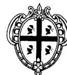
REGIONE AUTÒNOMA DE SARDIGNA REGIONE AUTONOMA DELLA SARDEGNA